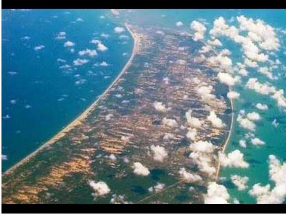
Ram Sethu from airplane

உள்ளன. அதன் மீது அவர் சயனம் செய்து யோகம் செய்த காரணத்தால் இவ்வூர் "தர்ப்ப சயனம்" என்றும் "திருப்புல் அணை" என்றும் பெயர் பெற்றது. கடல் ராமனுக்கு அடங்கவில்லை, எனவே அவர் அக்னி அஸ்திரத்தை விட முனைகிறார், பின்னர் கடல் அமைதியானது. கோயிலில் மிக ப்ரம்மாண்ட தர்ப்ப சயன ஸ்ரீராமர் உள்ளார்.