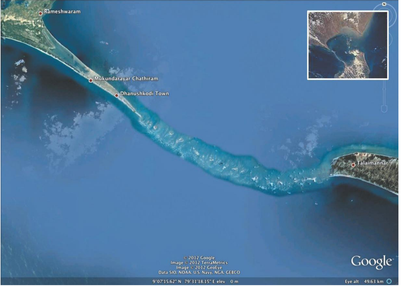
Nasa satellite photo of Ram Sethu