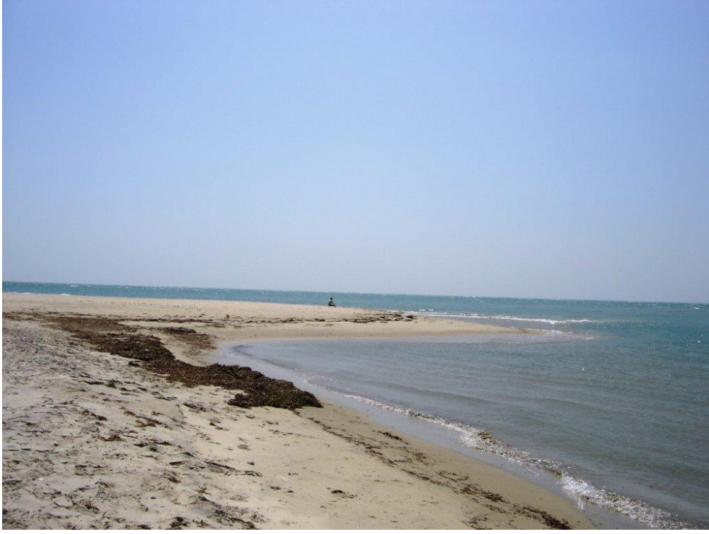
Danushkoti – beginning of Ram sethu

ராவணனைக் கொன்ற தன் வினை தீர சிவபூஜை செய்த கரை.இக்கரையில் இருந்து இலங்கை 54 Km.